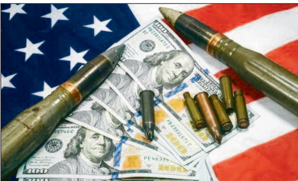
Rüstungsproduktion und Waffenhandel in den USA.

„Der Imperialismus, d. h. der Monopolkapitalismus, der erst im 20. Jahrhundert seine endgültige Reife erreicht hat, zeichnet sich aufgrund seiner wesentlichen wirtschaftlichen Merkmale durch eine weitaus geringere Liebe zum Frieden und zur Freiheit sowie durch eine stärkere und allgemeine Entwicklung des Militarismus aus.“