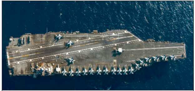
Der Flugzeugträger USS Gerald Ford.

wobei etwa 10 Milliarden Dollar bereitgestellt wurden, die für das Megaprojekt zum Bau von Chipfabriken (Fabs) in den USA benötigt werden, dessen Gesamtkosten sich auf etwa 550 Milliarden Dollar belaufen. Zudem hat er die Eröffnung von Minen und Raffinerien für Seltene Erden und kritische Materialien im Inland finanziert, ebenfalls für den Bau von Mikrochips. Zum Vergleich: Der jährliche Haushaltsposten des Verteidigungsministeriums zur Finanzierung der Mikrochip-