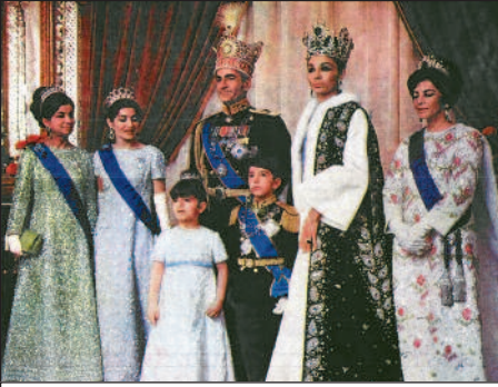
Die Familie des brutal regierenden Schahs Mohammad Reza Pahlavi.

Konzentration der Agrarproduktion und des Landbesitzes auf kapitalistischer Grundlage.“ (KP 20, S.32) Es war der Staat selbst, der in Allianz mit den ehemaligen Feudalherren Industriebetriebe v.a. im Konsumgüterbereich gründete und die Form der realen Subsumtion der neuen Proletarier unter die kapitalistische Herrschaft prägte: „Die alten despotischen Verhältnisse zwischen dem Feudalherren, dem Beamten und dem Gendarmen auf der einen Seite und dem schlimmer als Vieh behandelten Bauern auf der anderen wurden, so wie sie waren, auf die Industrie übertragen – Feudalherr und Beamte hatten sich in Kapitalisten verwandelt und der Arbeiter arbeitete unter der Kontrolle des Gendarmen. Es gab im Iran eine einzige ‘Gewerkschaft’, die Bestandteil des Staatsapparates war und deren Führer vom Savak [Geheimdienst des Schah-Regimes] ernannt wurden. In den Großbetrieben wurde praktisch unter Aufsicht des Savak gearbeitet (z.B. im Stahlwerk Arymehr 3000 – 3500 Arbeiter und 500 Savak-Agenten).“ (KP 24, S.14)