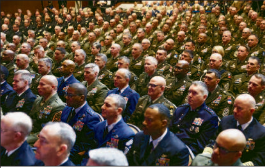
Der US-Militärapparat bereitet neue Kriege vor.

haben mehrere Studien veröffentlicht, die warnen: Die Vereinigten Staaten haben die industrielle und personelle Kapazität verloren, einen langwierigen Krieg in großem Maßstab zu führen. Der ehemalige Kommandeur der U.S. Army Europe, General Ben Hodges, hat öffentlich erklärt, dass die NATO nicht auf einen groß angelegten Krieg vorbereitet sei und dass die Frage der Massenmobilisierung diskutiert werden müsse. Ein weiteres Forschungszentrum, das Center for Strategic and Budgetary Assessments (CSBA), hat eine Studie veröffentlicht, die von Robert O. Work, dem ehemaligen stellvertretenden Verteidigungsminister