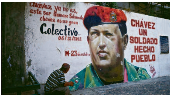
Chavez schaffte es mit seiner charismatischen Art, breite Teile der Bevölkerung zu begeistern.

Chávez schaffte es gut, sich politisch zu verkaufen. Mit seinem Projekt des „Sozialismus des 21. Jahrhunderts“ und dem Begriff der „bolivari-schen Revolution“ scharte er viele Anhänger und Unterstützer um sich, auch innerhalb der bürgerlichen Linken in Europa. Was sich für viele nach einem verkürzten Weg zum Kommunismus anhöre, war von Anfang an nichts anderes als ein sozialdemokratisches Reformprogramm vollgepackt mit pseudorevolutionären und absurden Illusionen – wie der oben genannte Punkt 1, wonach die kapitalistische Wirtschaft „ demokratisch [...] bestimmt werden soll [...] anstatt von