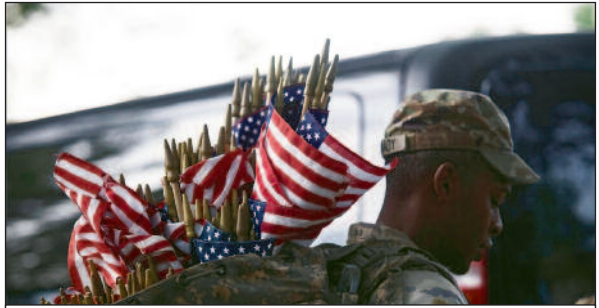
Gedenken an gefallene US-Soldaten.

die Waffen von der Industrie kauft), sondern eine Verschmelzung des gesamten kapitalistischen Finanzsystems, in dem die Grenzen zwischen Staat, Industrie, Technologie und Finanzkapital immer mehr verschwimmen. Das alte, von Eisenhower beschriebene Modell war linear: Das Pentagon unterzeichnet Milliardenverträge mit den großen Rüstungskonzernen (Big Five), diese liefern physische Waffensysteme zu Monopolpreisen und üben ihrerseits Druck auf den Kongress, die Regierung und das Pentagon aus, um ihre Monopolstellung zu erhalten. Das neue Modell ist ein integriertes und symbiotisches Netzwerk: die Regierung als strategischer Risikokapitalgeber. Die US-Regierung ist nicht mehr nur ein Käufer, sondern ein direkter Investor in Spitzentechnologien. Sehen wir uns einige Beispiele an. In-Q-Tel, der 1999 gegründete Risikokapitalfonds der CIA, war ein Pionier: Er investiert in Start-ups mit Dual-Use-Technologien (zivil-militärisch), die für den Nachrichtendienst kritisch sind (man beachte: Die Mittel der CIA gehören zu den intransparenten Fonds, die in den offiziellen Statistiken und vom SIPRI nicht erfasst werden); Das Verteidigungsministerium (oder Kriegsministerium) und die DARPA finanzieren Start-ups in den Bereichen KI, Mikroelektronik und Raumfahrt direkt und nehmen dabei das hohe Risiko in Kauf, um die entstehende Technologie zu kontrollieren.