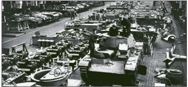
Die Panzerproduktion lief im 3. Reich auf Hochtouren.

Was von den Nationalsozialisten als nationales Wohlstandsprogramm verkauft wurde, war in Wirklichkeit ein gigantischer Raubzug gegen die eigene Bevölkerung und v.a. die Arbeiterklasse, die unter das Regime der absoluten Mehrwertabpressung gestellt wurde. Der emigrierte Linkssozialist Fritz Sternberg beschrieb die wirtschaftliche Situation in seiner 1935 in Amsterdam erschienenen Analyse „Der Faschismus an der Macht“: „Die künstliche Steigerung der Produktion war erreicht worden durch Aufrüstung und öffentliches Arbeitsbeschaffungsprogramm; die Unternehmer investierten nicht; die Kreditmärkte stagnierten völlig. Der Bestand an echten Handelswechslern der Reichsbank ging zurück, in gleicher Weise die Bilanzen der Großbanken. Der Binnenmarkt schrumpfte zusammen, da ein neuer Lohnraub eingesetzt hatte, und die neueingestellten Arbeiter kaum so viel verdienen, wie sie vorher Unterstützung bekamen; die Lage der städtischen Mittelschichten verschlechterte sich, da die Umsätze zurückgingen...“ (Sternberg, Der Faschismus an der Macht. Amsterdam, Contact, 1935, S.174)