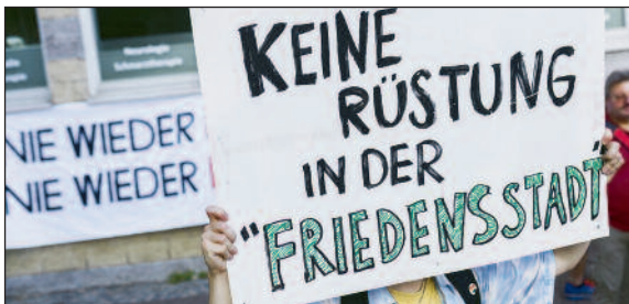
In Osnabrück gab es Proteste dagegen, dass VW in die Rüstungsproduktion einsteigt.

die Sprache der Manager, die Entlassungen und Lohnkürzungen ebenfalls gerne als „Effizienzprogramme“ bezeichnen. Auch von den zuständigen IGM-Funktionären ist nichts anderes zu erwarten.