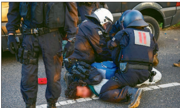
Polizeigewalt auf einer Demonstration – meist folgt auch noch eine Anzeige wegen Widerstand.

Darüber hinaus werden auch vermehrt Maßnahmen, wie die Aberkennung der Gemeinnützigkeit von Vereinen (zeitwei-