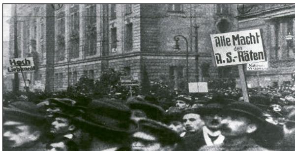
Klassenkampf ist vor allem ein Training für die bevorstehenden revolutionären Aufgaben des Proletariats.

Aber „draußen“ – wo denn? Unter dem Druck der wirtschaftlich-sozialen Widersprüche, die der kapitalistischen Produktionsweise innewohnen, und der seit Mitte der 70er Jahre andauernden Krise sowie angesichts der Degeneration der Gewerkschaften zu Regime-Gewerkschaften sind in Italien wie auch anderswo Kampforganisationen entstanden, die die Unzufriedenheit und den Kampfwillen zum Ausdruck bringen und sich gegen diese kompromissbereite und anti-proletarische Praxis stellen. Auf die wechselhafte Geschichte und den derzeitigen Niedergang dieser Organisationen werden wir vorerst nicht eingehen. Wir können nur kurz auf die Bilanz eingehen, die wir in Italien aus dieser ersten proletarischen Reaktion ziehen können: Es besteht kein Zweifel, dass es sich um einen gesunden Ausdruck der Unzufriedenheit der am stärksten ausgebeuteten Teile der Arbeiterklasse gegenüber den Regime-Gewerkschaften handelte. Doch nachdem die Kämpfe abgeebbt waren (aufgrund der Beilegung von Arbeitskonflikten, der Erschöpfung kollektiver Energien, der Umstrukturierung und Neuorganisation der Sektoren, in denen diese Organisationen tätig waren, sowie der offenen und weit verbreiteten Unterdrückung durch die Unternehmensführung und Staat), sind diese Organisationen zurückgegangen, haben sich gewissermaßen zusammengezogen und in sich selbst zurückgezogen, manchmal sogar in korporatistischer Weise, und haben in bestimmten Fällen den anfänglichen Solidaritätsschub in individualistische Auswüchse zerfallen