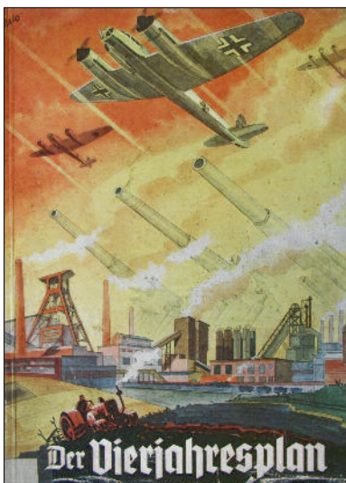
Die NS-Kriegswirtschaft dient heute wieder als Vorbild.

Die Kriegswirtschaftsoffensive der 1920er Jahre hatte zu hochproduktiven, aber vor dem Hintergrund der Weltwirtschaftskrise 1929/1930 größtenteils brachliegenden Produktionskapazitäten geführt, wodurch die kapitalistischen Investitionskapazitäten paralytisch waren. In dieser Situation war die kapitalistische Herrschaft weniger von der sozialdemokratisch und stalinistisch domestizierten Arbeiterbewegung bedroht, auch wenn zu dieser Zeit die Arbeiterkämpfe zunahm, als von dem Ende des Akkumulationszyklus. Und dies war übrigens keine rein deutsche Erscheinung. Zeitgleich mit der Absegnung von Hitlers Ermächtigungsgesetz im Deutschen Reichstag, ermächtigte der amerikanische Kongress im März 1933 den neuen Präsidenten Roosevelt zur autoritären Durchsetzung wirtschaftsdirigistischer Maßnahmen. Dieser erste erklärte „New Deal“ begann mit der Lenkung der Wirtschaft durch eine „National Recovery Administration“ (NRA), die von den Kriegswirtschaftsstrategen des Ersten Weltkrieges geleitet wurde. So war die im Juni 1933 gegründete NRA dem „War Industries Board“ von 1917 nachgebildet, mit der damals die gesamte US-Wirtschaft der Kriegsführung unterstellt worden war. Ihre Aufgabe war die Aufstellung und Überwachung von Pro-