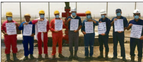
Streik in der Öl- und Gasindustrie 2024.

sich als Teil der weltweiten Arbeiterbewegung auf dem Weg zur proletarischen Revolution entwickeln und darf nicht zum Fußvolk für die anachronistische bürgerliche Demokratie werden. Hierfür benötigt sie ihr eigenes Programm, ihre eigene Strategie und Taktik und ihre Organisation, kurzum ihre Partei. Die Bedingungen dafür werden nicht allein im Iran, sondern international geschaffen, durch die Entwicklung der Internationalen Kommunistischen Partei.