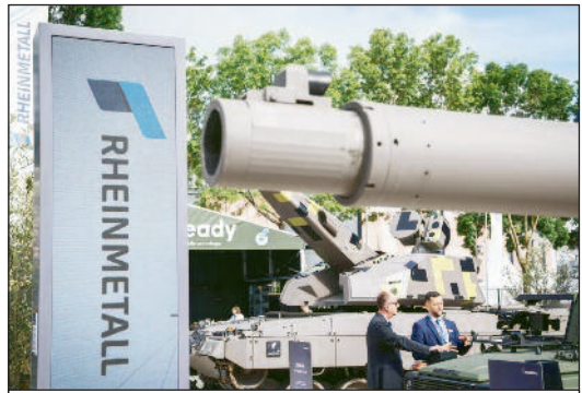
Staatliche Rüstungsausgaben sollen die Wirtschaft ankurbeln, sind aber nicht nachhaltig.

Es war die Pioniertat des Faschismus, eine solche Wirtschaftskonjunktur durch die endgültige Niederwerfung der Arbeiterbewegung und die Zusammenfassung des Kapitals unter einem Kommando durchgesetzt zu haben. Der deutsche Imperialismus litt vor hundert Jahren nicht nur an den Folgen seiner Niederlage im ersten imperialistischen Weltverteilungskrieg. Seine kapitalistische Rationalisie-