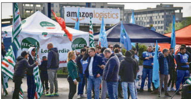
Die Streiks werden u.a. von der FIT-CISL organisiert und in „geordnete“ Bahnen gelenkt.

Hauptanliegen von CGIL, CISL und UIL darin besteht, das Unternehmen effizient, produktiv und wettbewerbsfähig zu halten und Löhne, Vorschriften und Arbeiterrechte unterzuordnen. Das spezifische Verhalten in jedem einzelnen Unternehmen ist nichts anderes als die tägliche Umsetzung der allgemeineren Strategie eines institutionalisierten Gewerkschaftswesens, das zunehmend dem Wohlstand der nationalen Wirtschaft untergeordnet ist. Das konkrete Handeln eines Gewerkschaftswesens, das zu einer Institution des bürgerlichen