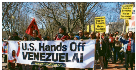
Proteste gegen die US-Interventionen sind oft mit falschen Sozialismus-Vorstellungen verbunden.

Inzwischen gibt es erste Verträge zwischen den USA und Venezuela, was die Ausbeutung von Erdöl und anderen Rohstoffen, z.B. Gold betrifft. So wurde bereits Erdöl im Wert von insgesamt 500 Millionen Dollar verkauft, davon verblieben 200 Millionen bei den Vereinigten Staaten. Kurzfristig ist aber nicht zu erwarten, dass die venezolanischen Rohstoffe eine große Rolle für die USA spielen werden, zumal für deren Ausbeutung hohe Investitionen und ein langer Atem notwendig sind. Der US-Präsident Trump hat einen 100 Milliarden Dollar teuren Wiederaufbauplan vorgelegt, der bei den US-Erdölkonzernen auf wenig Begeisterung stößt. Die venezolanische Regierung hingegen ist zu fast jedem Deal bereit, der dazu beitragen kann, die schweren wirtschaftlichen Probleme des Landes wenigstens zu verringern, weswegen es aktuell wenig Widerstand gegen die US-Intervention gibt und die Rohstoffe Venezuelas bereitwillig den US-Konzernen aushändigt werden.