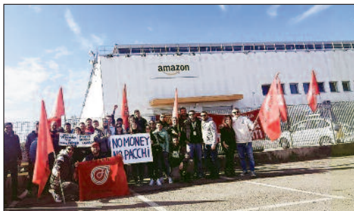
Proteste bei Amazon in Salerno.

Etwa 50 % aller Beschäftigten in Italien haben einen ausgelaufenen Arbeitsvertrag (Stand: Februar 2025); rund 6,3 Millionen der Arbeiter (und Angestellten) haben ein eingefrorenes Gehalt, während die Lebenshaltungskosten rasant steigen. Die Bosse haben sich praktisch dazu entschlossen, sich selbst einen Kredit zu gewähren und bei den Arbeitskosten zu sparen – unter dem ohrenbetäubenden stillschweigenden Einverständnis der Regime-Gewerkschaften: Lieber das Geld in der Kasse behalten, als gezwungen zu sein, die Gehälter an die stetig steigende Inflation anzupassen. Die Zahl der Arbeiter „in