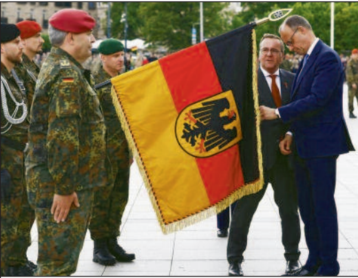
Deutschland bereitet sich auf den Krieg vor.

lung in einem damaligen Aufsatz über den Charakter der faschistischen Konjunktur mit Bezug auf den Roosevelt'schen New Deal: „In Amerika wurde die Krise 1933 nur auf dem Wege der staatlichen Zwangsmobilisierung des privaten Kapitals überwunden, durch inflatorische Vorwegnahme seiner Betätigung, und es scheint nicht, daß die amerikanische Prosperität diese Staatsinitiative entbehren könnte. Wenn umgekehrt das Privatkapital der Roosevelt-Administration auch diese Schattenfolge verweigert, tritt auch in Amerika die Alternative zwischen dem Eintritt in die Krise oder dem Ab-sprung in eine absolute, rein staatsinflatorische Investitionskonjunktur ein. Tatsächlich ist aber diese Alternative sowohl in England wie in Amerika be-