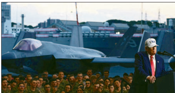
Mit einer nationalistischen Ideologie treibt Trump die Entwicklung der Kriegswirtschaft massiv voran.

sogar, sich in den Golfkriegen zu engagieren und diese größtenteils von ihren Verbündeten bezahlen zu lassen. Erst seit 2001 ist im Zusammenhang mit dem sogenannten ‘Krieg gegen den Terrorismus’ ein neuer Aufwärtstrend zu verzeichnen. Tatsächlich hängt dieser Anstieg mit der Rezession vor den Anschlägen vom 11. September zusammen sowie mit dem Auftreten neuer Konkurrenten um die Kontrolle strategisch wichtiger Gebiete in Bezug auf Handel und Energieressourcen: Osteuropa, Naher Osten, Südwestpazifik und Ost-