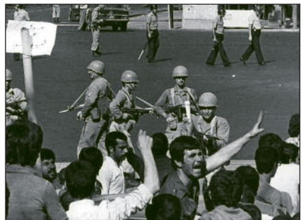
Iranische Ölarbeiter streiken 1978.

Die für die umfanglich Eingliederung des Iran in den Weltmarkt notwendige Auflösung der feudalen Strukturen stand im Zentrum der sog. „weißen Revolution“, die Mohammad Reza Pahlavi in den 1960er Jahren durchführte. Es handelte sich im Kern um eine „bürgerliche Revolution“ von oben, die allerdings statt auf ein eigenständiges nationales Entwicklungspotential auf die Fortführung der parasitären und vom Imperialismus abhängigen Herrschaft der korrupten Pahlavi-Monarchie orientierte. Die Großgrundbesitzer wurden entschädigt, während die Bauern gezielt der Verarmung Preis gegeben wurden. In einer mehrteiligen Untersuchung über die Ergebnisse der imperialistischen Herrschaft im Iran schrieben wir 1979: „Sozial gesehen bedeutet die 'weiße Revolution' in ihrem Ergebnis also nicht die Schaffung von bäuerlichem Kleineigentum, sondern die Abschaffung aller Fesseln, welche die Bauernschaft an den Boden binden. Dieser Prozess, der die unaufhaltsame Verelendung und Enteignung der eben Kleineigentümer gewordenen Bauern herbeiführt, ist zugleich ein Prozess der