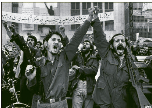
Anhänger der „islamischen Revolution“.

Arbeiter, sieht man von Lohnerhöhungen in der Erdöl-industrie ab, von der neuen Regierung keine soziale Forderung erfüllt bekommen; bestätigt bekommen haben sie aber seit dem Machtwechsel, dass sie Wasserträger ihrer neuen Unterdrücker waren. Khomeini forderte sofort den Abbruch des langen Generalstreiks, setzte ihn durch und erklärt seitdem sämtliche Arbeiterkämpfe für antirevolutionär und gottlos.“ (Die islamische Revolution lässt ihren Schleier fallen, Proletarier Nr.5, Sept. / Okt. 1979) Die soziale Unterdrückung wurde im neuen Regime durch eine brutale Unterdrückung der Frauen ergänzt, die Unterdrückung nationaler Minderheiten wurde nahtlos fortgesetzt.