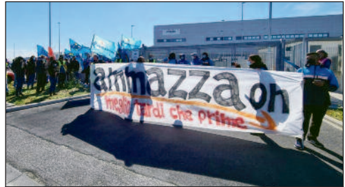
Ein Wortspiel: Die Arbeitsbedingungen bei Amazon zerstören die Gesundheit und töten.

Das ist es, was unsere Genossen heute tun können. Im Übrigen zeigen die Telekommunikationsbeschäftigten selbst keinerlei Anzeichen von Kampfgeist und haben nicht einmal auf die zahlreichen Aufrufe der wenigen kämpferischen Kollegen reagiert, die Präsenzversammlungen einberufen wollten, insbesondere als es zu Spannungen unter den Beschäftigten kam – im Zusammenhang mit direkten Echtzeit-Kontrollen per Telematik, durch die Vorarbeiter/Manager (die gemäß Art. 4 des Arbeiterstatuts L. 300/1970 verboten wären), den extrem anstrengenden Arbeitsrhythmen, dem Fehlen von Freistellungen und den vom Unternehmen auferlegten Urlaubstagen. In einem Umfeld allgemeiner Arbeitslosigkeit, prekärer Beschäftigungsverhältnisse und Armut, wie es in Süditalien herrscht, fühlen sich die jungen Telekommunikationsarbeiter als „Glückliche“, als Privilegierte, und verhalten sich tatsächlich wie eine Arbeiteraristokratie, indem sie die Forderungen der Callcenter- und Logistikmitarbeiter im selben Unternehmen ignorieren und noch größere Lohnunterschiede fordern.