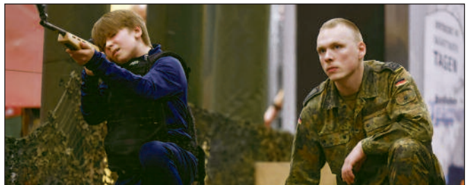
Die Jugend als Kanonenfutter für imperialistische Kriege.

Die mit dem Ende der erweiterten Wiederaufbauphase nach dem Zweiten Weltkrieg in den 1970er Jahren wieder einsetzende wirtschaftliche Krisenentwicklung führte zu vielfältigen Angriffen auf die Lebens- und Arbeitsbedingungen des Proletariats. Als Ersatz für die „Dividende des sozialen Friedens“ etablierte der Staat in den 1980er Jahren eine neoliberale Agenda der sozialen Verwahrlosung. Mit der Annektion der DDR konnte der deutsche Imperialismus die Ende der 1980er Jahre immer größer werdende Wirtschaftskrise hinausschieben und v.a. ein ideologisches Siegesgeschrei anstimmen. Allerdings war natürlich auch die Wiedererwachte deutsche Großmachtsucht nicht in der Lage, die weitere kapitalistische Krisenentwicklung aufzuhalten, sondern konnte nur versuchen, ihre Folgen für das Kapital zu minimieren und in die EU zu externalisieren (hier seien nur die Stichworte „Harz IV“ und „Grie-