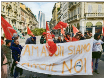
Ohne die Transport- und Logistikarbeiter steht bei Amazon alles still.

lassen sie bei getrennten Streiks im Stich... natürlich bei Scheinstreiks, mit Vorankündigung, zeitlichen Begrenzungen und ohne wirklichen Schaden für das Unternehmen! Gleiche Situation und gleicher Scheinstreik für die Logistikmitarbeiter, von denen etwa 14.500 ohne Vertrag sind. Unter dem ausgeklügelten Vorwand unterschiedlicher Streitfälle und vertraglicher Regelungen, die die korporative Mentalität schüren, die ganz selbstverständlich bei Akademikern, Fachkräften und Technikern vorherrscht, haben sie die Taktik von Streiks an nahe beieinander liegenden, aber unterschiedlichen Terminen bevorzugt und damit ihre Arbeit fortgesetzt, jede noch so kleine Einheit in den Kämpfen zu zerstören!