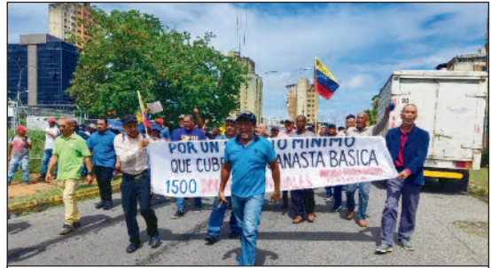
Nucleo proletario clasista – eine proletarische Gruppe kämpft für höhere Löhne.

tricks, die Beteiligung des Staates oder eine Änderung der Eigentümer irgendetwas. Im Gegenteil dienen gerade Instrumente des Co-Managements, die wir aus Europa nur zu gut kennen (man denke an die Betriebsräte in Deutschland) dazu, die Arbeiterklasse noch besser für die Kapitalinteressen einzubinden und zu integrieren. Und auch sogenannte „selbstverwaltete“ Fabriken, wie wir sie beispielsweise aus Argentinien kennen (z.B. Zanon), bringen zwar den Beweis, dass die Arbeiter die Produktion auch ohne Kapitalisten fortsetzen können, führen aber letztendlich zu einer Selbstausbeutung unter kapitalistischen Konkurrenzverhältnissen für den Markt.