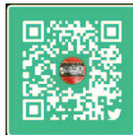
X / Twitter