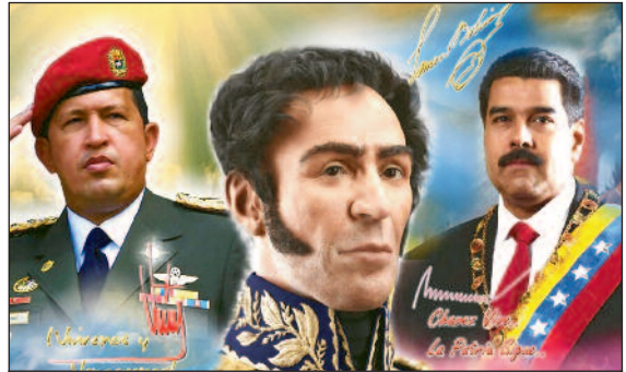
Die 3 bürgerlichen Revolutionäre von links: Hugo Chavez, Simon Bolivar und Nicolás Maduro.

Auf der anderen Seite sind viele Menschen aus dem linksbürgerlichen Milieu von der US-Aggression, vor allem deshalb so empört, weil sie große Illusionen in das chavistische Projekt des „Sozialismus des 21. Jahrhunderts“ haben. Dabei ist die „bolivarische Revolution“, nichts anderes, als eine bürgerliche Regierungsvariante, die es relativ gut schafft, die „kulturelle Identität“ der venezolanischen Bevölkerung auszudrücken (und diese insoweit auch besser integriert) und deshalb in offenen Konflikt mit der US-freundlichen alten bürgerlichen Elite geraten ist. Im Gegensatz dazu wird die Maduro-Regierung sowohl von der alten venezolanischen Elite als auch vom Westen als diktatorisch gebrandmarkt und man inszeniert sich als Verteidiger vermeintlicher demokratischer Freiheitswerte. Hier verhält es sich aber genauso wie mit dem Völkerrecht: man ist dafür, wenn es den eigenen Interessen nutzt, man ist dagegen, wenn es ihnen schadet!