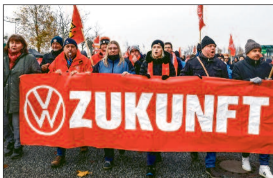
Die Beschäftigten bei VW kämpfen um eine Zukunft für sich und ihre Arbeitsplätze.